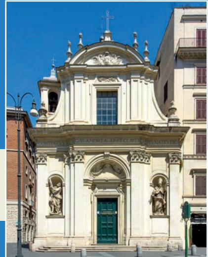
Église Saint-André et Saint-Claude des Francs-Comtois de Bourgogne à Rome

JOURNÉE PLACÉE SOUS LE SIGNE DE L'AMITIÉ ENTRE LA LORRAINE ET LA BOURGOGNE FRANCHE-COMTÉ