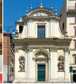
Église Saint-André et Saint-Claude des Francs-Comtois de Bourgogne à Rome