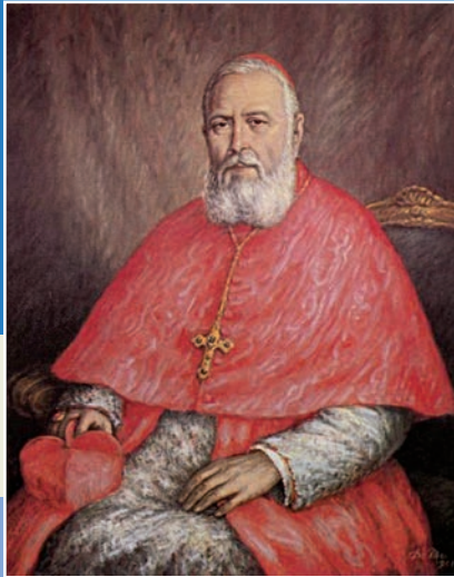
Le cardinal Tisserant

HOMMAGE AU CARDINAL EUGÈNE TISSERANT JUSTE PARMIS LES NATIONS